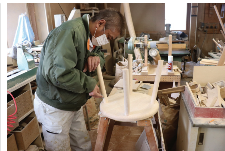
～ 子どもの安全を第一に考え作る ～

宍粟市では出産された方に出産祝い品として、木のおもちゃをプレゼントしています。森林面積が9割を占める宍粟市で生まれ、自然を身近に感じ、すくすくと元気に育ってもらいたいという気持ちからです。その出産祝い品を作っているのが、合同会社チェシャーズ・ファクトリーです。