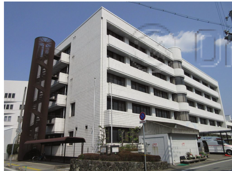
～ 18歳までの子ども医療費は無料 ～

結婚して一緒に暮らし始めると何かとお金がかかります。宍粟市では新婚世帯を応援するため、住居費を助成しています。アパートなどの賃貸料や引越費用が最大30万円支給されます。金銭的な理由で結婚に踏み切れない方にとっては、有難い制度です。