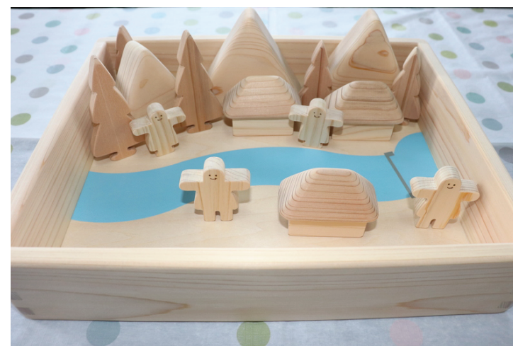
～ 森からの贈り物 ～

宍粟市では出産された方に出産祝い品として、木のおもちゃをプレゼントしています。森林面積が9割を占める宍粟市で生まれ、自然を身近に感じ、すくすくと元気に育ってもらいたいという気持ちからです。その出産祝い品を作っているのが、合同会社チェシャーズ・ファクトリーです。