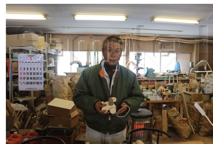
～ 森の中のウッドクラフト工房 ～

小さな子どもが使うものですので、安全を第一に考えて作っています。誤飲がないように細かい部品は取れないようにし角に当たって怪我をしないよう面取りをしています。塗料は安全性の高いドイツ製の物を使用し、安全第一で作っています。子どもに安心して遊んでもらうため、細心の注意を払っています。