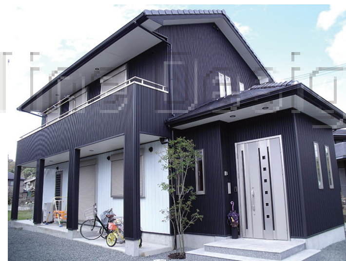
～ 住宅取得に最大140万円の助成 ～

森林面積が9割の宍粟市では、木育を推進しています。木のおもちゃが出産祝い品としてもられ、自然を身近に感じ、豊かな心をはぐくんでもらえるよう色々な制度があります。閉園した染河内幼稚園を染河内森のようちえんとして、5月下旬に開園を予定しています。都会とは違い、自然の中でのびのびと子育てできるのが宍粟市の良さです。