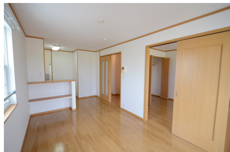
～ 新婚世帯の住居費を助成 ～

結婚して一緒に暮らし始めると何かとお金がかかります。宍粟市では新婚世帯を応援するため、住居費を助成しています。アパートなどの賃貸料や引越費用が最大30万円支給されます。金銭的な理由で結婚に踏み切れない方にとっては、有難い制度です。