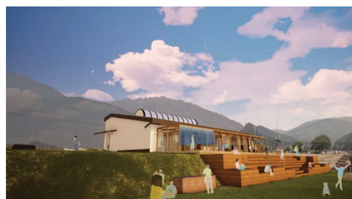
～ 森林で子育て ～

風邪を引いたり子どもはよく病気にかかります。子どもにかかる医療費も子育てする上では非常に負担になっています。宍粟市では18歳まで子どもの医療費は無料です。ちょっと気になる事でも、気兼ねなく病院に行けるので安心です。