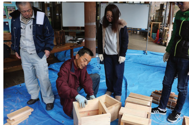
～ 苦難の2年間 ～

日本蜜蜂は別名で、“森の自由な住人”と呼ばれています。非常に自由な性格で、気に入らないことがあると、我慢せず巣箱から集団で逃げていきます。巣箱に入っても逃げられることが多いため、飼うことが非常に困難です。しかしその蜜は、非常に芳醇な味わいがあるのが特徴です。西洋蜜蜂と違い大規模に飼育することが出来ないため、非常に貴重なものとなります。