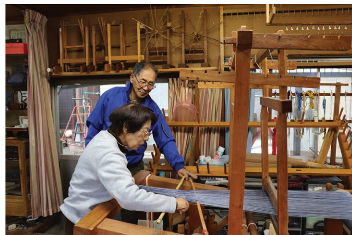
～ 次の世代に伝えたい ～

兵庫県伝統的工芸品に指定され、兵庫県ふるさと文化賞、山崎町文化功労章など数々の賞を受賞されています。さらに平成11年のミラノコレクションに出展されました。藍染は日本だけでなく、世界的にも”ジャパブルー”として広く認知されており、化学染料では出せない奥深い青色が外国の方にも人気です。