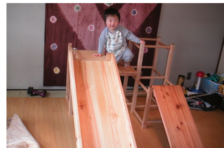
～ 人に優しいものを ～

ご夫婦二人とも出身は東大阪です。長野県の学校で木工を学んだ後、自然豊かな場所で暮らしたいという思いから、移住先を探していたところ、波賀町長の強い誘いがあり移住することを決めました。