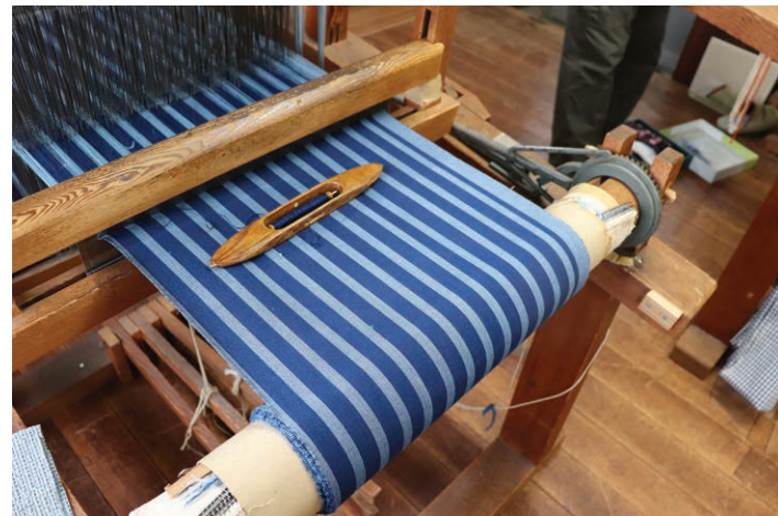
～ 世界のジャパブルー ～

化学染料と違い、藍染は気温などの自然条件に大きく影響を受けます。また染料に浸し、水洗いと中干しを行い、20～35回も繰り返して染め上げるため、大変な手間と労力がかかります。自然由来の染料であり、自然条件に大きく影響を受けるからこそ、まったく同じように染め上がるものがなく世界にひとつだけのものになります。