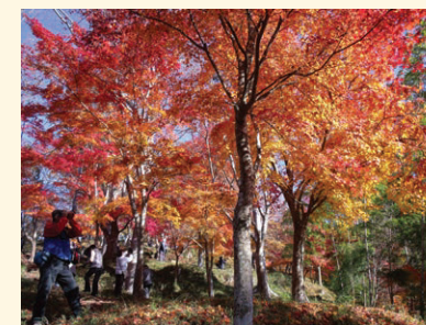
山崎町 最上山公園のもみじ山は、県内でも有数の紅葉スポットです。