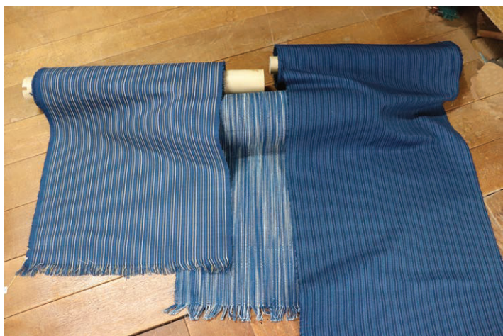
～ 同じものがひとつとしてない ～

藍染は古くから山崎でも盛んに行われ、綿花の栽培・染色・機織り・着物等の作製まで、地域内で行われていました。しかし大正以降に発達した化学染料におされ、大変な手間と労力がかかる藍染は衰退していきました。そんな中、先代の正木国枝様がほぼ独習で復活させ、現在正木竣雄様（72歳）が活動されています。