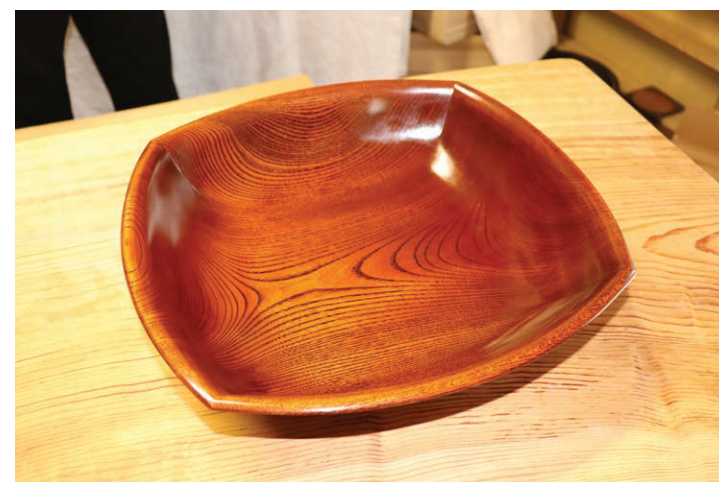
～ 緑と緑とがつながり波賀町へ ～

自然豊かな宍粟市波賀町齊木の山の中腹に 木工芸 山清があります。富島清様・清子様 ご夫妻が平成2年に移住し、工房を開きました。その木工に対する技術と芸術性は日本伝統工芸にも入選されるほどで、その技術を生かし木製のカップ・お皿からアスレチック遊具まで、原木の仕入れ・デザイン加工・塗装仕上げを一貫してされています。