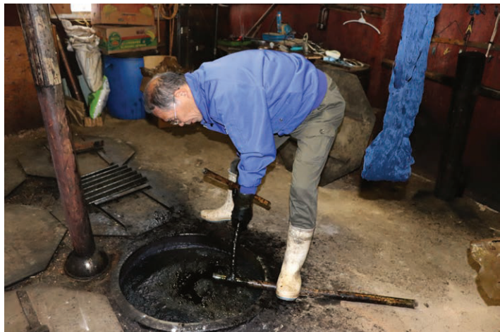
～ 藍染が盛んだった山崎 ～