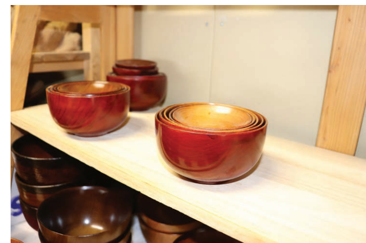
～ 沢山のの人に支えられて ～

作品を作るうえで一番大切にしていることは、“人畜無害で人に優しいもの”です。長く使って頂きたいので、人の害になるようなウレタン系樹脂などは使用しません。また使いやすいように細かな工夫がされており、20年30年と長く使ってもらえるよう工夫されています。お皿からアスレチック遊具まで、人に優しいものという気持ちで作製しています。