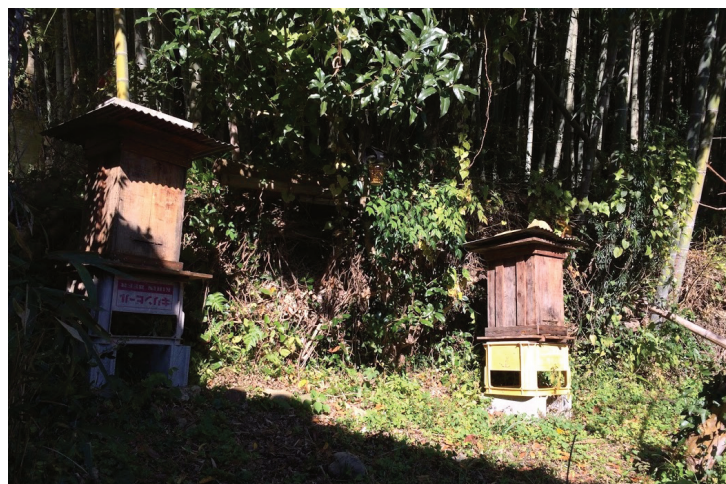
～ 森の自由な住人 ～

日本固有の蜜蜂である日本蜜蜂は、古くから里山などに生息してきました。しかし近代農業が普及し、農薬などが使われ、自然環境が大きく変化したことにより、生息数が減少しています。