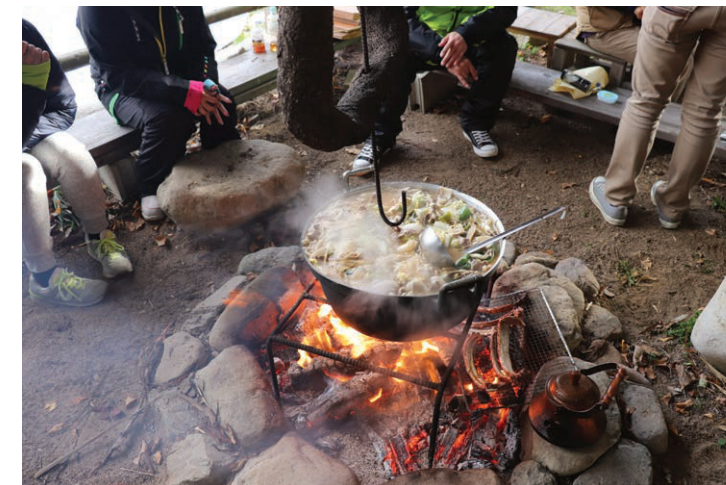
～ 最後は特製猪鍋を食べつつ交流会 ～

捕った鹿の解体も見学・体験することができます。捕ってすぐに血抜きや内臓を取らないと、肉が獣臭くなるそうです。適切な処理をきちんとすれば、鹿も美味しい肉になることが分かりました。皮を剥ぎ、内臓を取り出す時は、目を背けたくりますが、こいう作業を通して肉になったものを食べ、自分の命になっていることを実感できました。