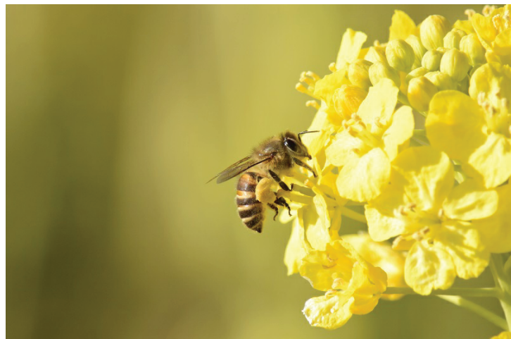
～ 激減した日本蜜蜂 ～

日本固有の蜜蜂である日本蜜蜂は、古くから里山などに生息してきました。しかし近代農業が普及し、農薬などが使われ、自然環境が大きく変化したことにより、生息数が減少しています。