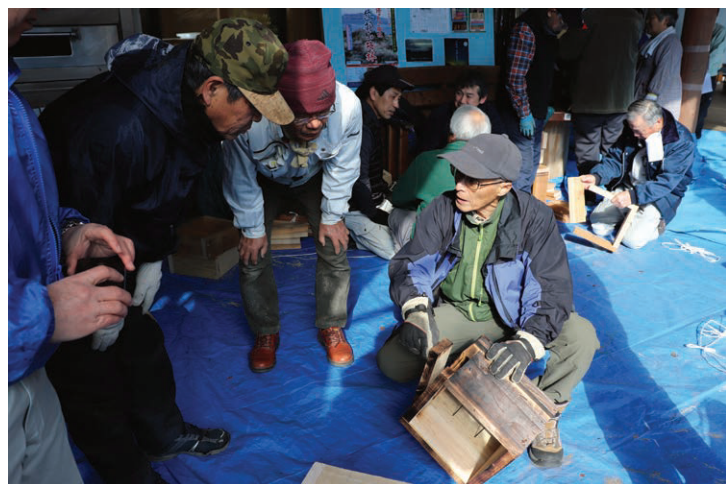
～ 自然の奥深さを知ってほしい ～

養蜂を知らない初心者が始めたため、全く蜜蜂が巣箱に入ってくれない期間が、2年間も続きました。しかし諦めることなく、巣箱を改良したり、置く場所を変えてみたりする中で、3年目にしてやっと入るようになりました。