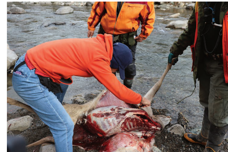
～ 肉になるまで ～

狩猟場所は、一宮町のまほろばの湯の近くの高峰と繁盛地区でした。猟犬を放ち、鹿が追い立てられ出てきたところを、猟師が仕留めます。山には猟犬の鳴き声と銃声が響き渡り、普段感じる事のない緊張感を体験できます。どちらの場所でも一頭ずつ鹿を仕留めることができました。多い日では、一日に7～8頭捕れる時もあるそうです。