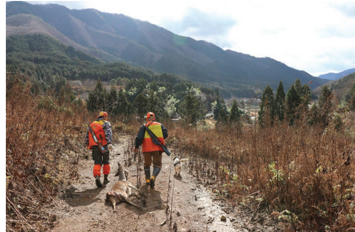
～ 山に響き渡る犬の鳴き声と銃声 ～

宍粟市では現在、鹿・猪が増加しています。しかしそれらの獣を捕獲する猟師の方が高齢化などの影響で減少しています。普段見る機会がない狩猟を、少しでも多くの方に体験してもらい、狩猟の奥深さと宍粟の魅力を知ってもらいたいと、MORE繁盛（はんせ）様が狩猟体験を企画されました。