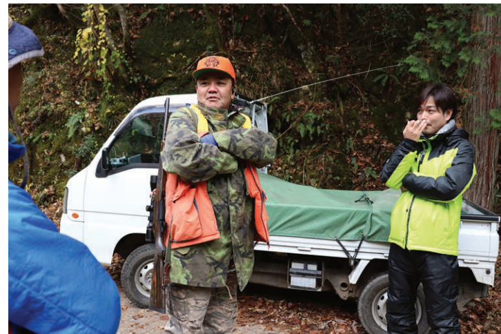
～ 鹿・猪の増加と猟師の減少 ～

宍粟市では現在、鹿・猪が増加しています。しかしそれらの獣を捕獲する猟師の方が高齢化などの影響で減少しています。普段見る機会がない狩猟を、少しでも多くの方に体験してもらい、狩猟の奥深さと宍粟の魅力を知ってもらいたいと、MORE繁盛（はんせ）様が狩猟体験を企画されました。