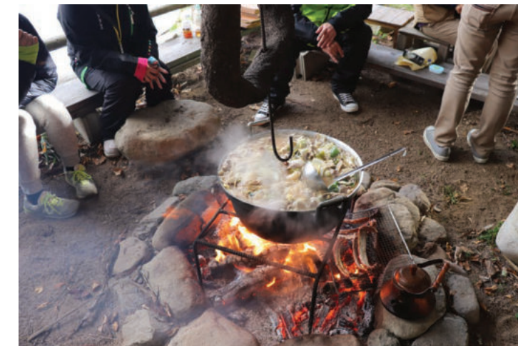
～ 最後は特製猪鍋を食べつつ交流会 ～

捕った鹿の解体も見学・体験することができます。捕ってすぐに血抜きや内臓を取らないと、肉が獣臭くなるそうです。適切な処理をきちんとすれば、鹿も美味しい肉になることが分かりました。皮を剥ぎ、内臓を取り出す時は、目を背けたくりますが、こいう作業を通して肉になったものを食べ、自分の命になっていることを実感できました。