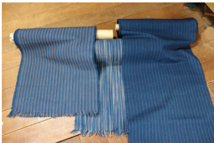
～ 同じものがひとつとしてない ～

藍染は古くから山崎でも盛んに行われ、綿花の栽培・染色・機織り・着物等の作製まで、地域内で行われていました。しかし大正以降に発達した化学染料におされ、大変な手間と労力がかかる藍染は衰退していきました。そんな中、先代の正木国枝様がほぼ独習で復活させ、現在正木竣雄様（72歳）が活動されています。