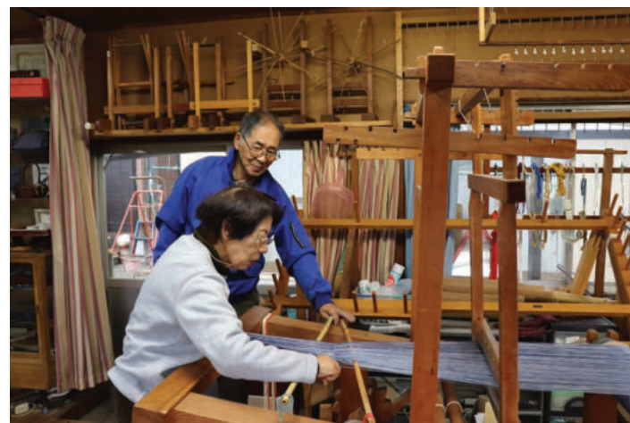
～ 次の世代に伝えたい ～

兵庫県伝統的工芸品に指定され、兵庫県ふるさと文化賞、山崎町文化功労章など数々の賞を受賞されています。さらに平成11年のミラノコレクションに出展されました。藍染は日本だけでなく、世界的にも”ジャパンプルー”として広く認知されており、化学染料では出せない奥深い青色が外国の方にも人気です。