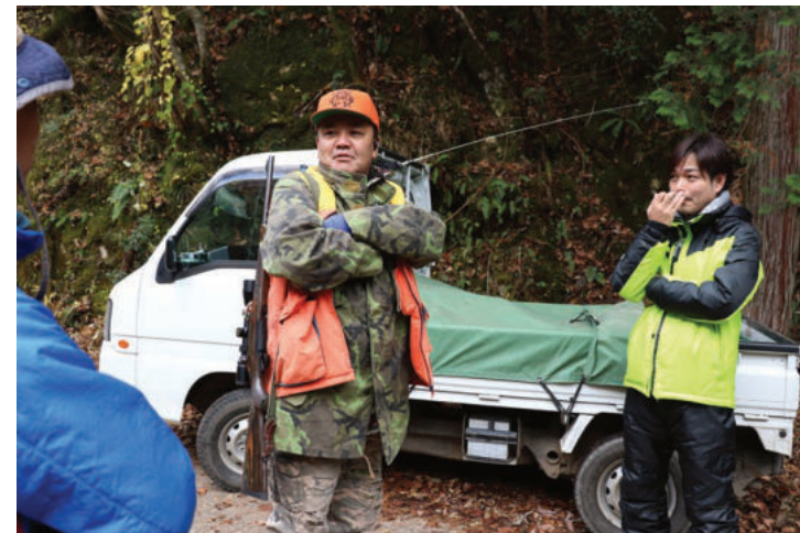
～ 鹿・猪の増加と猟師の減少 ～

宍粟市では現在、鹿・猪が増加しています。しかしそれらの獣を捕獲する猟師の方が高齢化などの影響で減少しています。普段見る機会がない狩猟を、少しでも多くの方に体験してもらい、狩猟の奥深さと宍粟の魅力を知ってもらいたいと、MORE繁盛（はんせ）様が狩猟体験を企画されました。